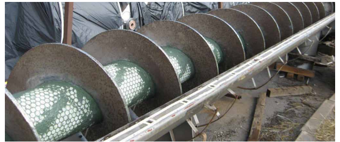
使用贝尔佐纳(Belzona) 1813 和氧化铝瓦片修复后的螺旋式输送带