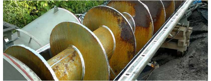
受损的螺旋式输送带

贝尔佐纳(Belzona) 1813 不仅具备极佳的耐磨损性, 而且对多种化学物质均具有耐化学性。